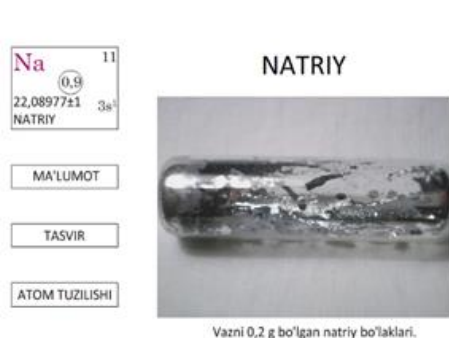
5-rasm.Natriy metalining tasviri.