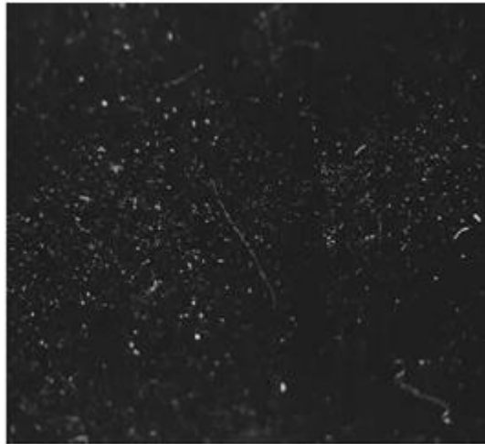
2 - rasm. Oq bo‘rning havodagi zarrachalari.

Bugungi kunda ko‘plab maktablar va maktab o‘qituvchilari qo‘llar va sinflarni toza saqlash uchun changsiz sutga botirilgan oq bo‘rni tanlaydilar. Ammo yangi tadqiqotga ko‘ra, oq bo‘rdagi bu tanlov sut allergiyasi bo‘lgan o‘quvchilarda (talabalarda) allergiya va astma alomatlarini keltirib chiqarishi mumkin.